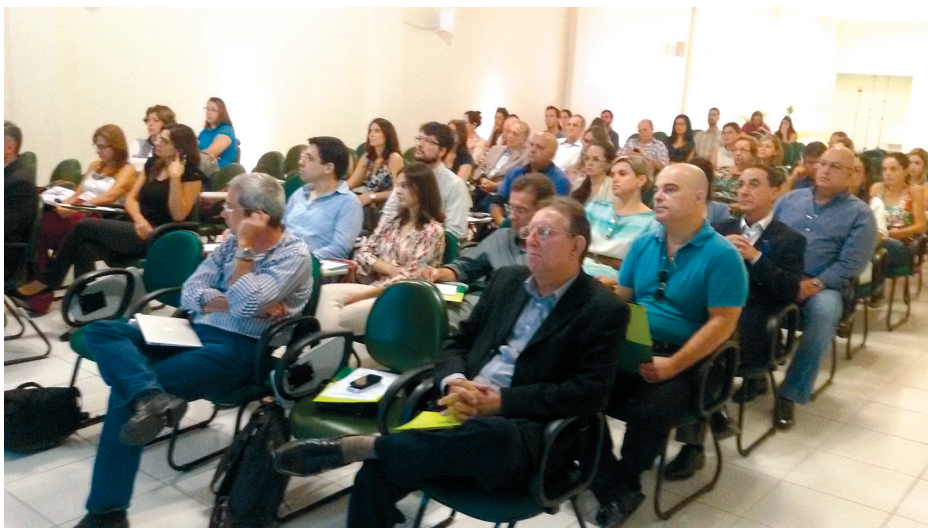
O auditório lotado demonstrou o sucesso do evento