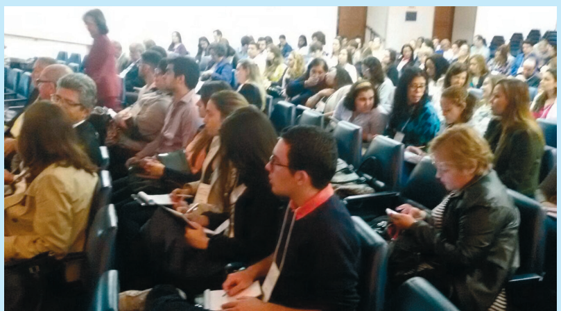
Primeiro Simpósio de Perinatologia do Rio de Janeiro