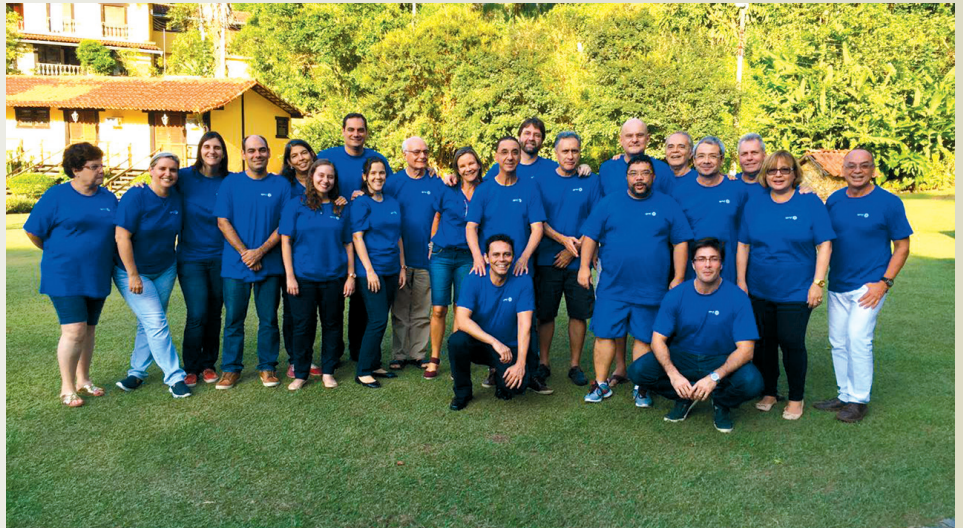
Diretores da SGORJ presentes ao evento em Pirai-RJ

– “Fatores externos” nos ameaçam (financiamento, credibilidade, desinteresse), mas também podem significar oportunidade de avaliarmos nosso propósito (visibilidade do Rio de Janeiro, congressos mundiais, prevenção de doenças infecto-contagiosas). Nossa tradição, capacidade técnica, sede e pa-