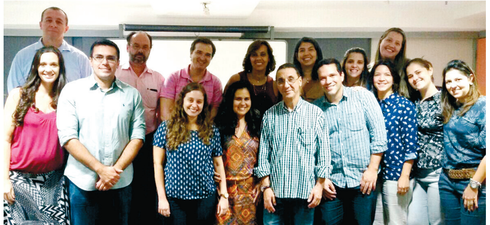
Coordenadores das residências médicas do Rio de Janeiro e diretores da SGORJ unidos em prol do aprimoramento dos residentes e fortalecimento do vínculo SGORJ-jovens médicos

A SGORJ, nesse sentido, diz muito obrigado a todos pela disponibilidade e comprometimento.